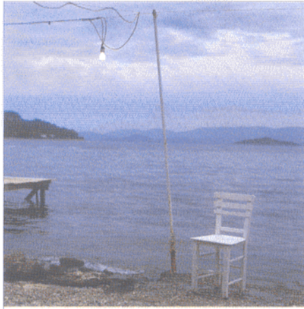
Yeni Marmara / Sitki Kösem en Hıppon Özgüç

Sitki Kösem en 1955'de doğdu. ODTÜ'de Mimarlık eğitimi gördü. İlk fotoğraflarını 1983'te sergiledi. Onları, bugüne değ in 12 kişisel sergi, 5 ajanda, 4 kitapta ("Haliç 1993", "Boğaziçi Yazıları", "2000", "Beyoğlu, Ben") yer alan fotoğraf projeleri izledi. "Türkiye Portreleri" ve "Avrupalı" adlı iki kısa filmi var. 2001'de "Leica Camera" tarafından "2002 Leica Günlük"te fotoğraflarına yer verilen dünyanın 12 sanatçısından biri seçildi.