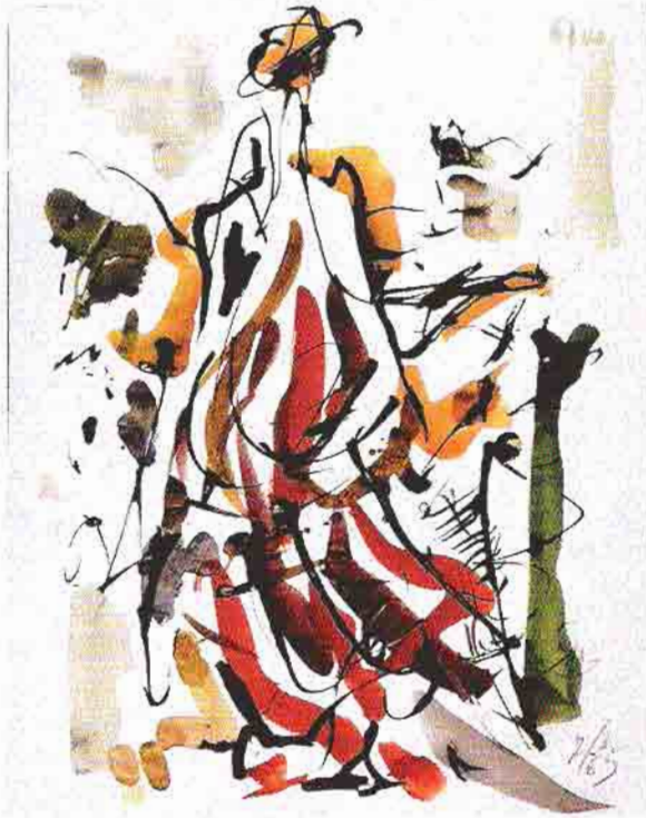
Zeki Fak İzer, Kağıt üzerine kanşık teknik, 1965